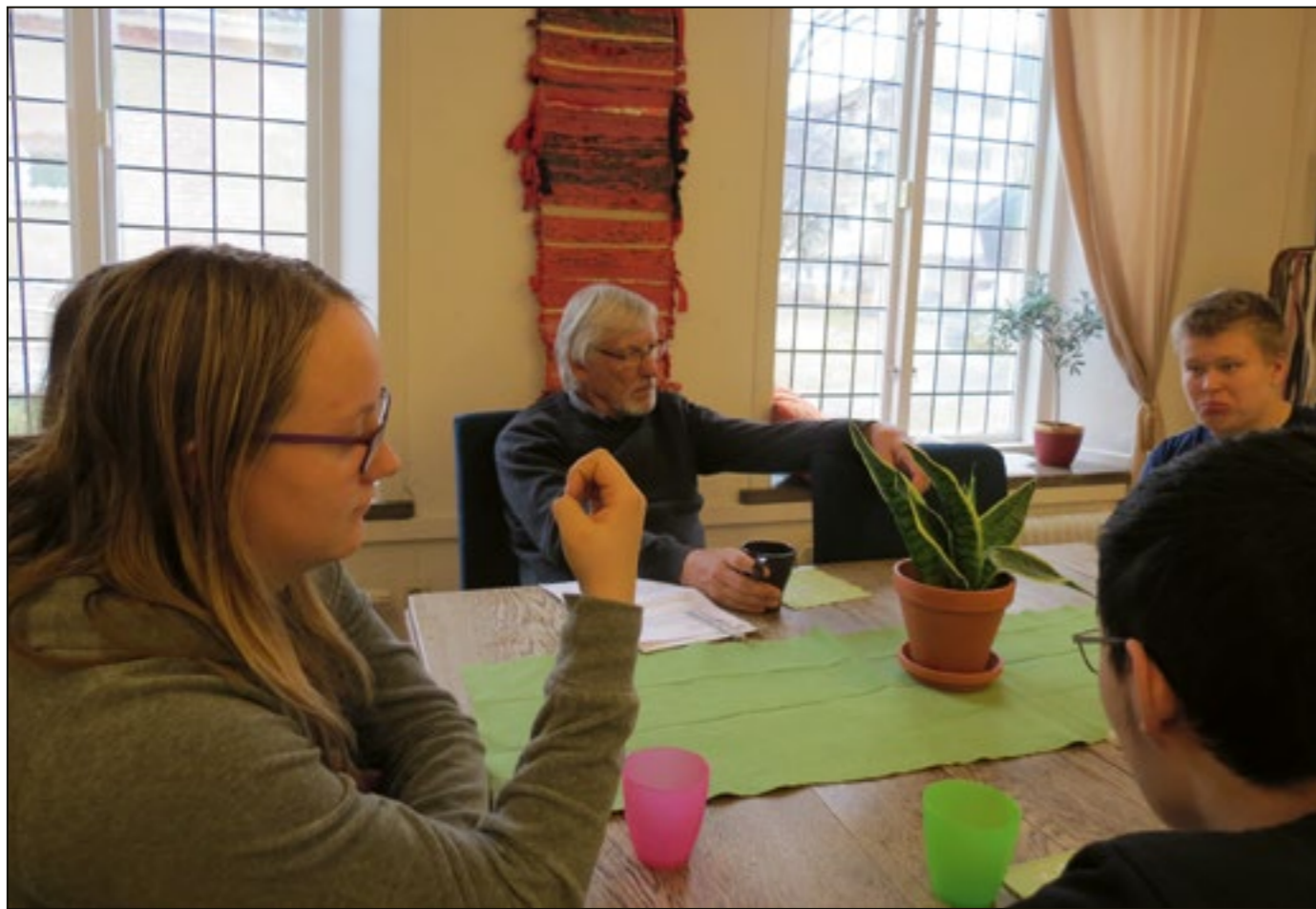
Samtalen över fikabordet är en viktig del av Dialogforum. Här kan var och en berätta om just sin situation.