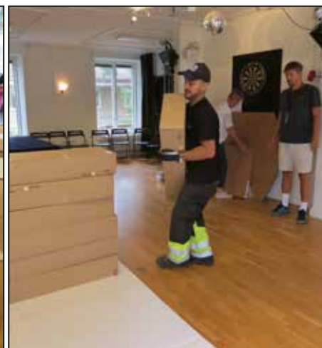
Samlingssalen blev byggarbetsplats.